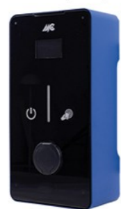
ORION 7, 11, 22kW