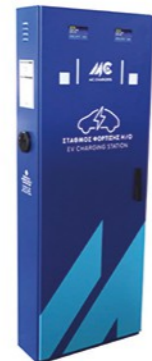
ORION AC 2x11, 2x22kW