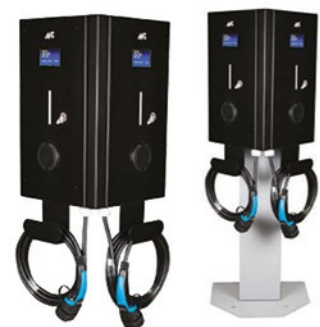
PRISMA AC 7, 11, 22kW