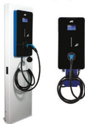
ORION AC 7, 11, 22kW